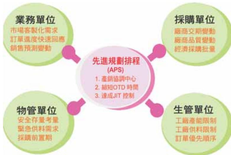
圖：鉅茂資源協同管理

野寶的生產基地分佈於兩岸三地，台灣本部以研發行銷及製造高級產品為主，廣東深圳廠以提供歐洲市場之中等級產品為主；江蘇崑山廠以提供美洲及日本與中國內銷產品為主。