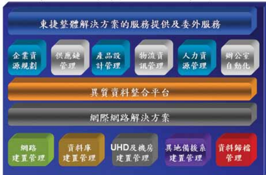
圖：東捷資訊提供整體委外服務