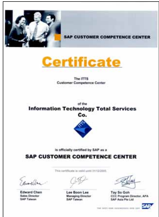
圖：獨家獲得SAP「客服加值中心」認證

為確保客戶服務品質，東捷率先引進了 SAP 售後服務機制「客服加值中心」(SAP Customer Competence