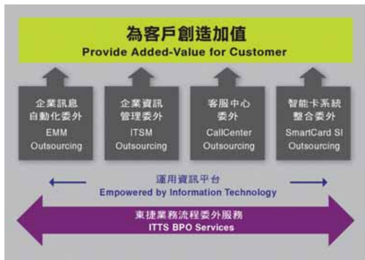
圖：東捷四大事業部

歷經 10 年以上技術研發及專案經驗的累積，使東捷成為台灣各大企業最信賴與委託的長期合作夥伴，知名企業如中央健保局、花旗銀行、中國信託、國泰