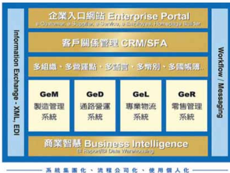
圖：Global eOffice 架構

統即面臨更換的壓力，以符合運作。而在激烈的競爭環境中如何爭取客戶、創造更大商機，作好客戶關係管理是管理者們共同面對的問題，利用 e-Business 與上下游廠商溝通、提供 BI 決策資訊給主管作正確的決策，正是提昇企業競爭力的另一項利器。