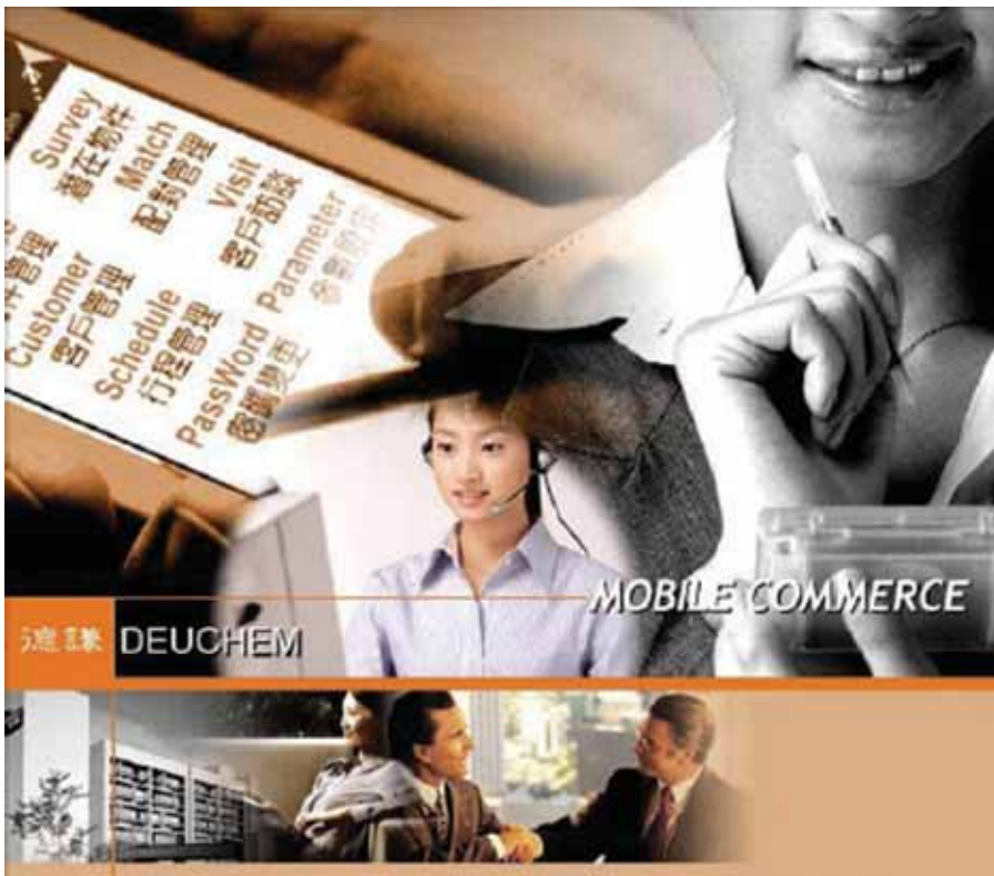
圖：德謙的行動商務系統

另外，值得一提的是德謙企業的行動商務產品 (Softprovider M-Commerce)。鑑於德謙企業業務範圍遍及兩岸三地及全球，傳統以電話或傳真詢問報價資訊的方式已經無法滿足業務人員對資訊即時性的需求，往往造成了銷售決策上的瓶頸。其次，業務人員攜帶沉重、開機緩慢的筆記型電腦外出進行簡報、報價、銷售等營業活動，雖然已較傳統作業方便，但不